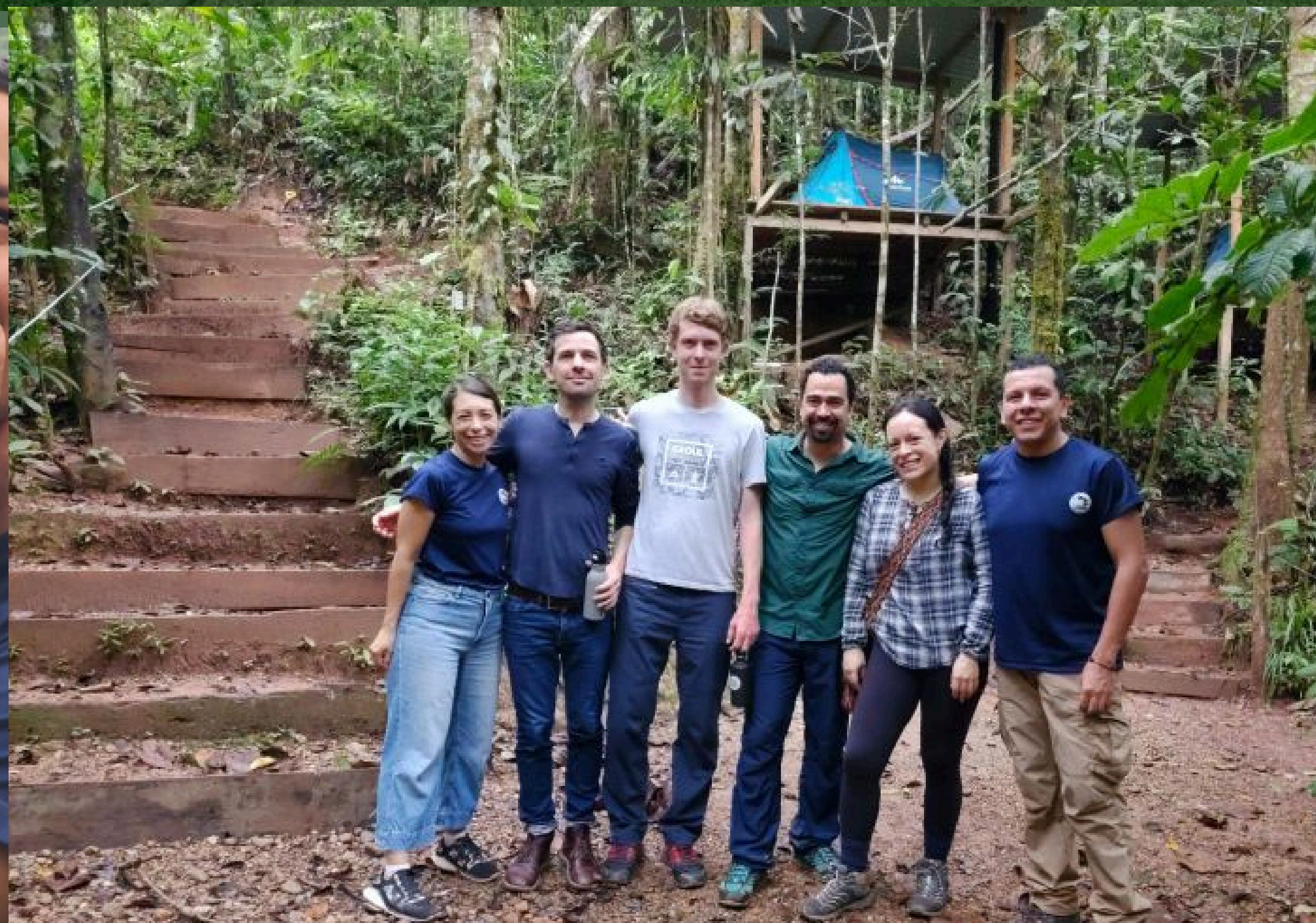
Embajada de Reino Unido en Colombia