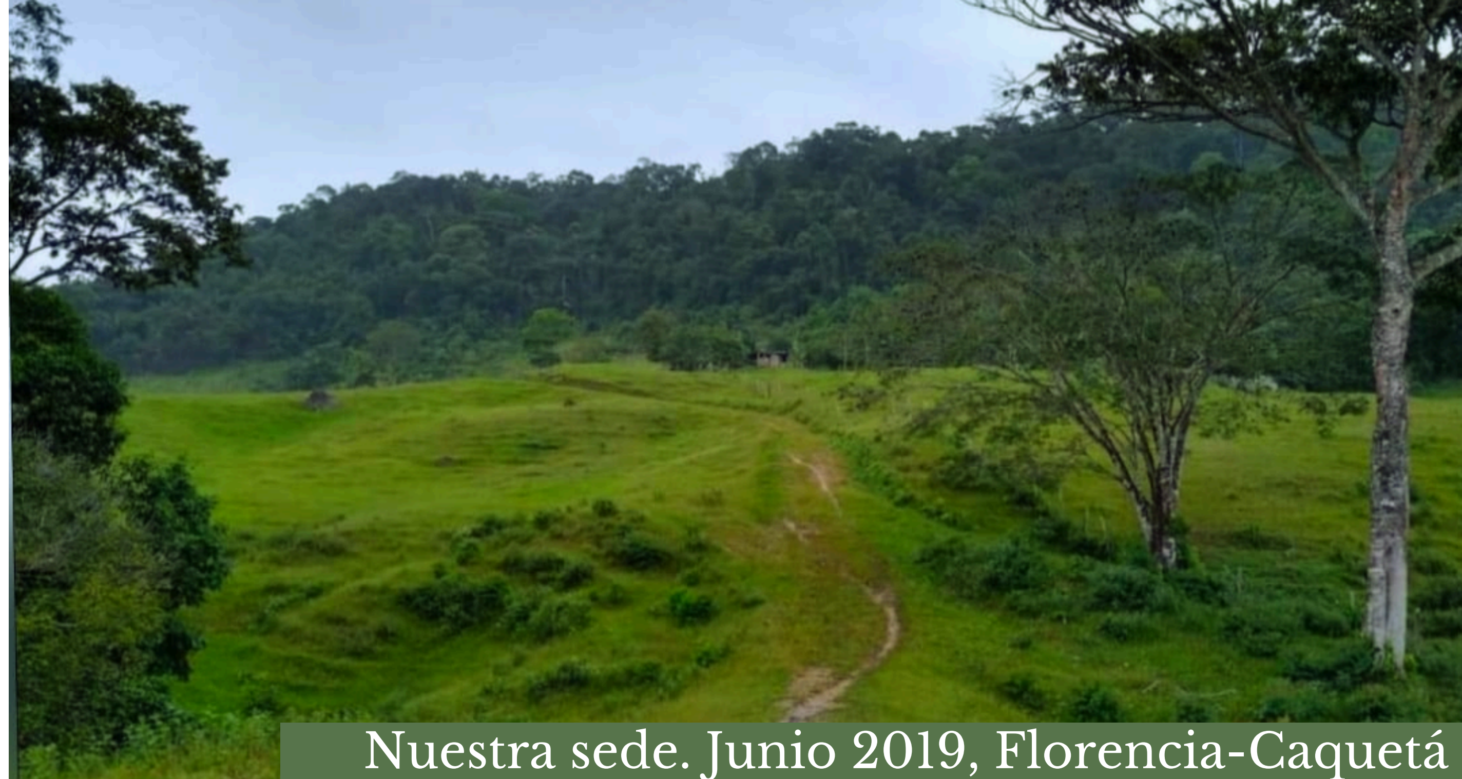
Nuestra sede. Junio 2019, Florencia-Caquetá