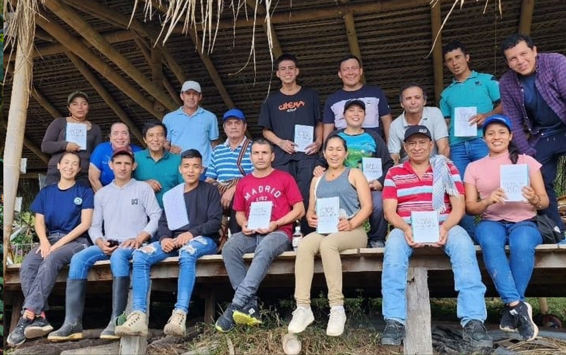
Comunidades campesinas del Pato-Balsillas- Socio: USAID