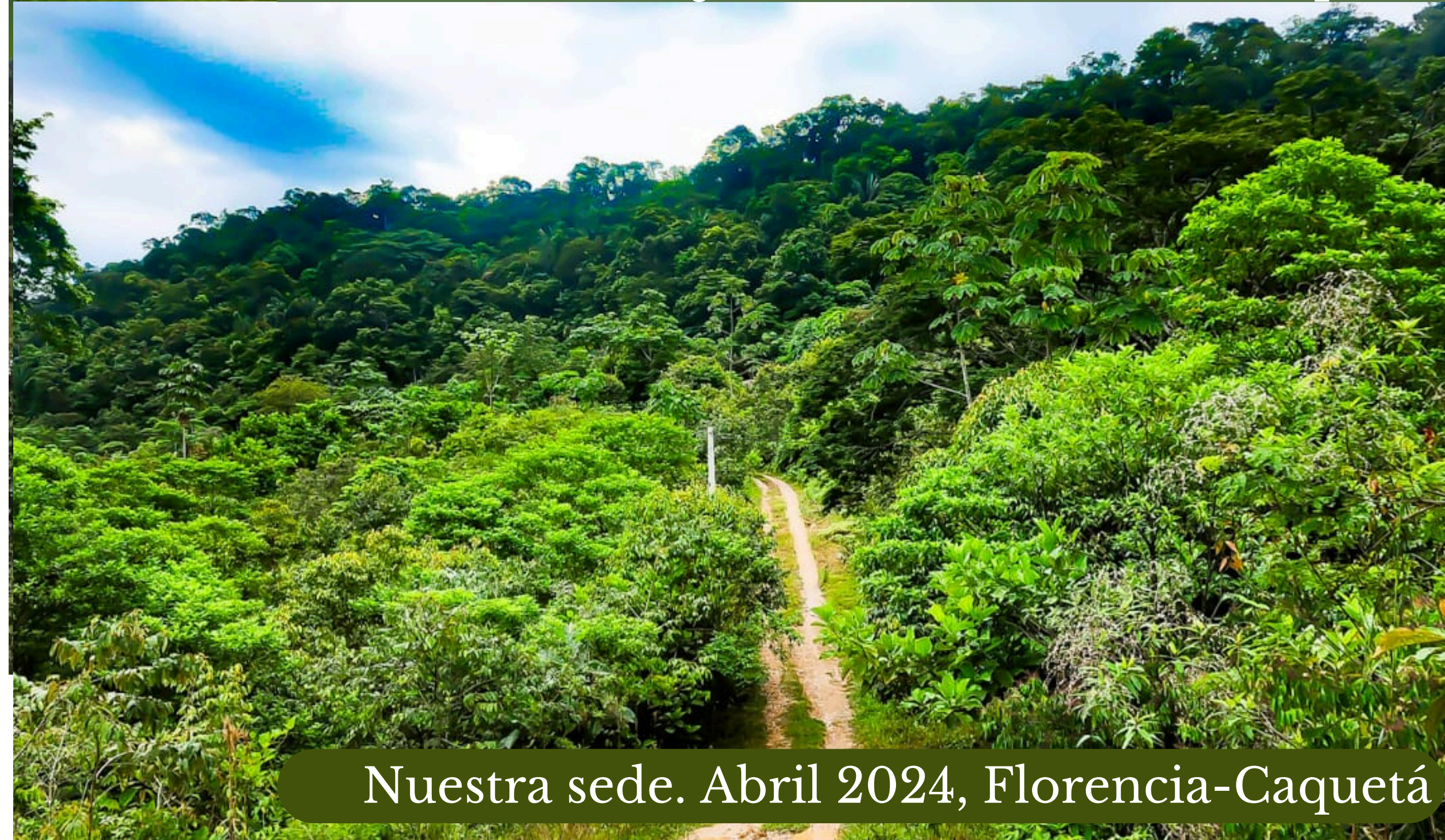
Nuestra sede. Abril 2024, Florencia-Caquetá