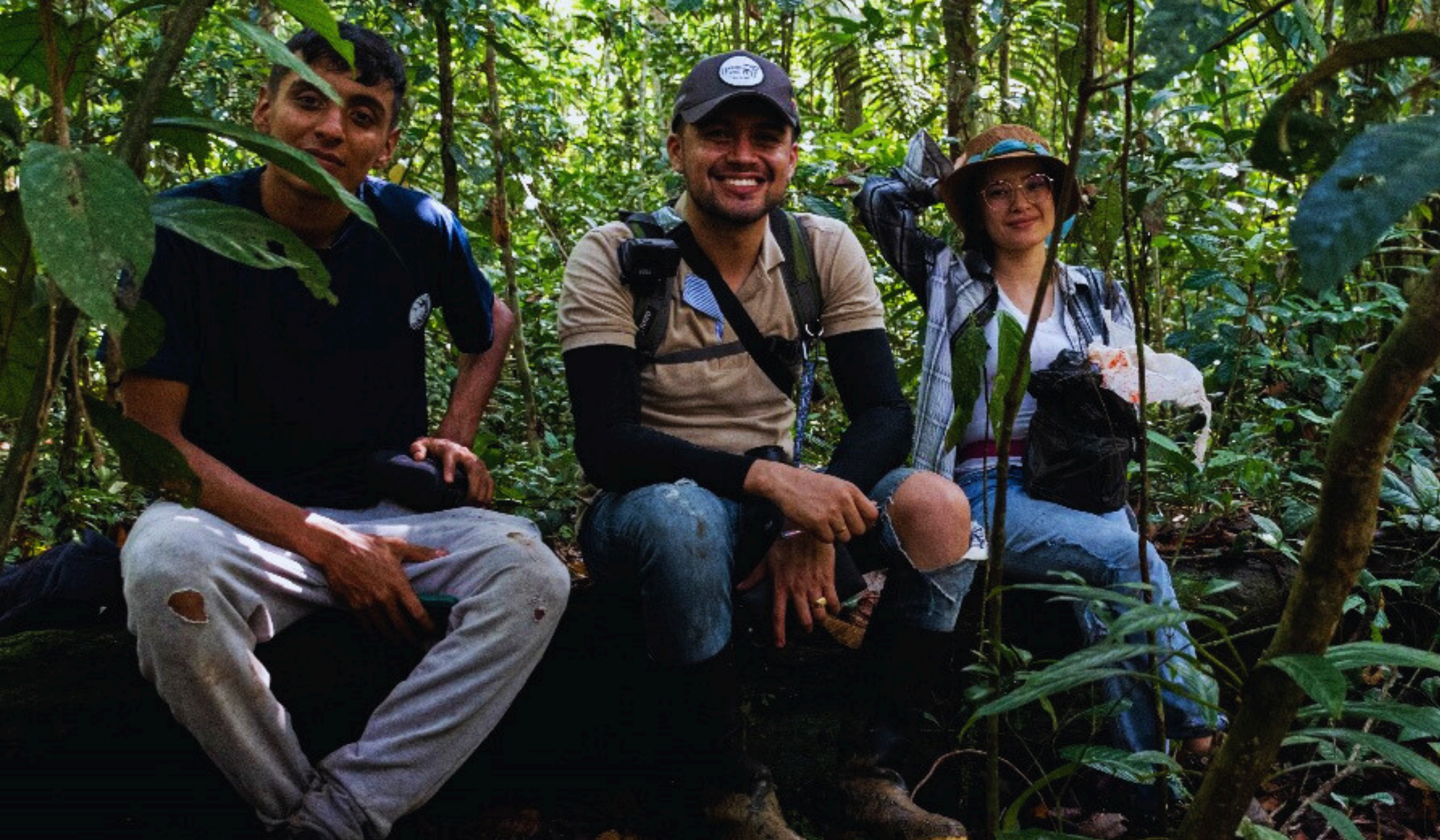
Jóvenes ganaderos de Valparaiso-Caquetá. Socio: Nestlé