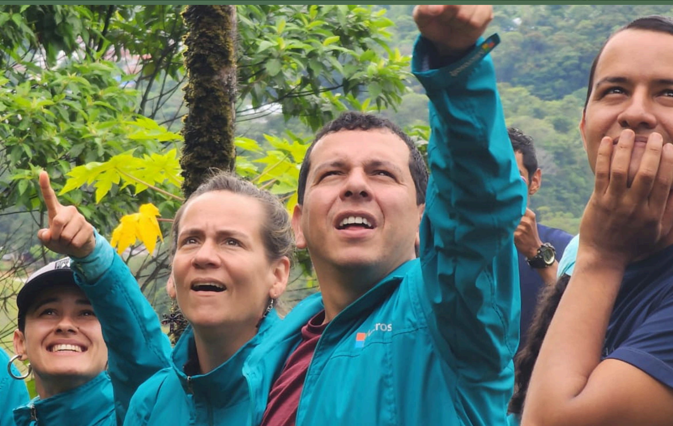
Equipo de Microsoft Colombia